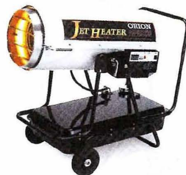
■ HPE250 熱出力：強 29.2KW / 弱 20.0KW 希望小売価格：174,000 円