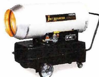
■ HPS830A 熱出力：97.2KW 希望小売価格：320,000 円