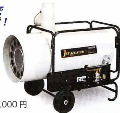
■ HS290-L 熱出力：33.3KW 希望小売価格：310,000 円