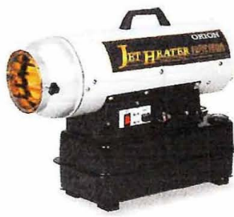
■ HPE150A 熱出力：17.0KW 希望小売価格：124,000 円