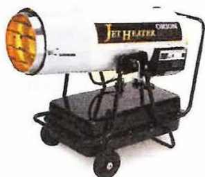
■ HPE370 熱出力：強 43.0KW / 弱 32.0KW 希望小売価格：196,000 円