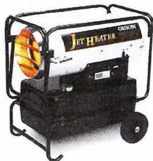
■ HPE310-L 熱出力：35.0KW 希望小売価格：182,000 円