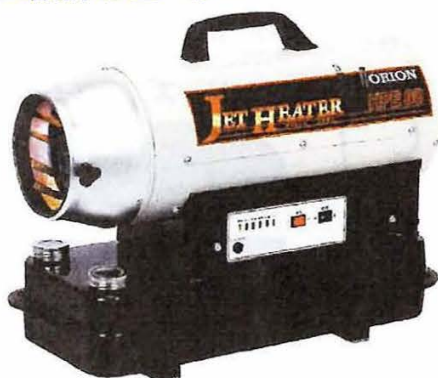
■ HPE80A 熱出力：8.8W ~ 6.3KW 希望小売価格：91,000 円