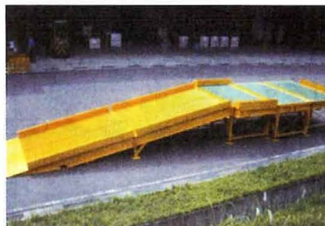
●重量積載荷重タイプ