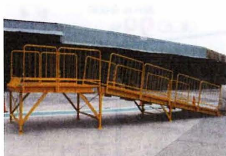
●サイドガード 1000H タイプ