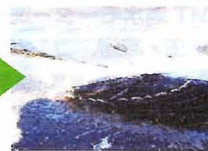
●カキ養殖用網 (洗浄後)