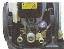
真ちゅう製シリンダー 80℃迄の給水可能