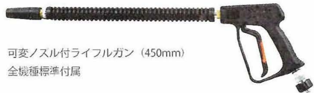
可変ノズル付ライフルガン (450mm) 全機種標準付属

希望小売価格：SEC-1012-2：130,000円 SEC-1015-2：165,000円