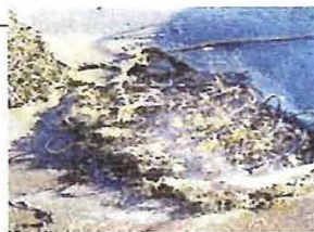
●カキ養殖用網 (洗浄前)