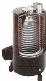
●ステンレス製ヒートコイルボイラー