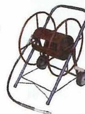
ホースドラム HL型 3/8で80m巻可