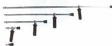
ランス(トリガーガン用) 5種類 (5cm,10cm,40cm,70cm,110cm) を用意しています。