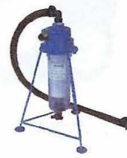
川水フィルター (中間ホース付) 100メッシュ 水量: 40ℓ/min