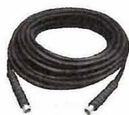
高圧ホース (10m,20m) カブラ付