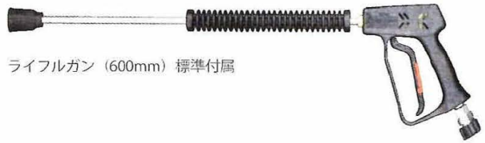
ライフルガン (600mm) 標準付属