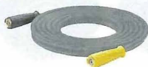
食品専用高圧ホース標準装備