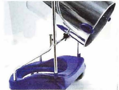
● WD77P/WD76S 用ゴミ廃棄方法